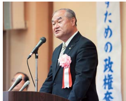
長尾公明党徳島県本部代表